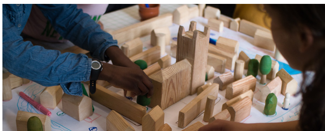
Atelier du service Patrimoine à deux pas de la Maison du Brie de Meaux

La visite-atelier ne pouvant accueillir que 15 enfants pour que chacun puisse en profiter au maximum nous vous proposons ci-dessous quelques idées d'activités pour occuper l'autre partie du groupe !