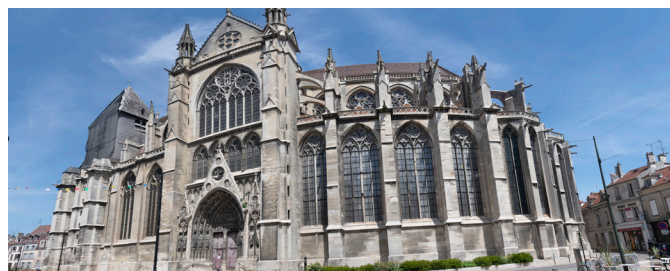
Visite de la cité épiscopale de Meaux

Plus d'informations en ligne sur : www.meaux-marne-ourcq.com/groupes